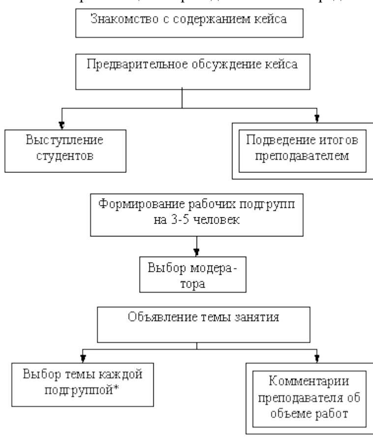
Стадия организации работы над кейсом

Последовательность организации и проведения занятий представлена на рисунках.